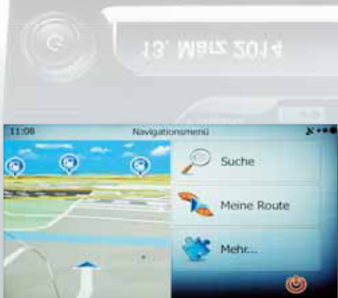
Navigationssoftware von NNG