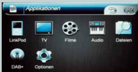
DAB+ und DVB-T sind optional erhältlich