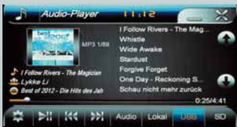
Album-Cover werden angezeigt

Der Ratzeburger Hersteller Al-Car hat unter der Marke Easinav eine ganze Reihe fahrzeugspezifischer Naviceiver im Programm. Wir testen das Modell für den Fiat Ducato.