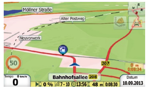
3D Navigation für ganz Europa