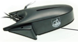
AL-CAM 11 „Heckkamera“