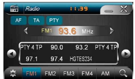
Radio (AM/FM) mit RDS