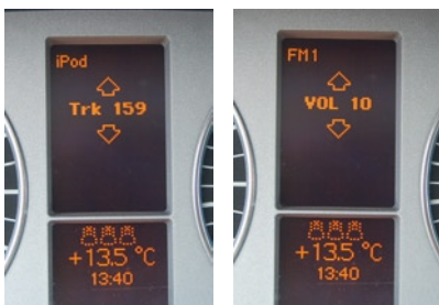
die Tachoanzeige im Kombiinstrument zeigt die wichtigsten Informationen an.

EASINAV Drive ist die neueste Generation Navigationsgeräte. Sie ist kfz-spezifisch und perfekt auf das jeweilige Fahrzeug abgestimmt. Dies zeigt sich nicht nur am hervorragenden Designs in Originaloptik, sondern auch an der technischen Integration. So ist es z.B. möglich, die Lenkradfernbedienung zu nutzen um Telefonate anzunehmen und aufzulegen. Wichtige Informationen wie die Radiofrequenz oder die Titelnummer der CD-Wiedergabe werden auf dem Kombiinstrument im Tacho angezeigt. Um Ihnen eine intuitive Touchscreen-Steuerung zu ermöglichen haben wir eine übersichtliche Benutzeroberfläche (GUI) entwickelt. Einige Screenshots finden Sie auf der rechten Seite.