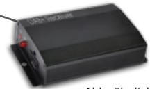
Abb. ähnlich DAB+ Empfänger