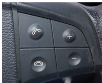
Mit den Tasten der Lenkradfernbedienung können die Grundfunktionen gesteuert werden.

Die Ausstattungs-Highlights sind ein 3D Navigationsystem mit Karten von 46 Ländern mit Premium TMC, Radioempfang mit RDS, ein DVD Laufwerk das alle gängigen Audio- und Videoformate abspielt, eine Bluetooth Freisprecheinrichtung mit Audiostreaming und Telefonbuchübertragung sowie eine USB und AUX Schnittstelle.